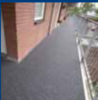
Galerijverhoging en balkonverhoging