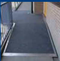
Individuele aanpassingen (WMO), vlonders en hellingbanen