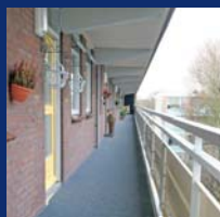
Galerijverhoging en balkonverhoging